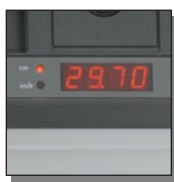
Affichage digital des dimensions

Ce massicot électrique dispose d'une tenue professionnelle et de nombreux équipements à vous couper le souffle.