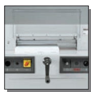
Carter de protection avant