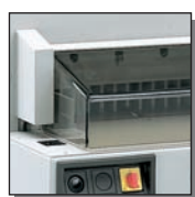
Carters de protection avant et arrière