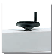
Dispositif de pression par volant