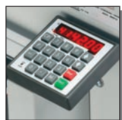
Commande électronique programmable EP